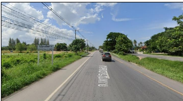
ภาพที่ ๓ แสดงสภาพถนนที่เกิดอุบัติเหตุ

บริเวณที่เกิดเหตุถนนเพชรเกษมขาขึ้นกรุงเทพฯก่อนถึงด่านตรวจสามร้อยยอด ๒๐๐ เมตร หลัก กม.ที่ ๒๕๖+๓๐๐ หมู่ที่ ๘ ตำบลศิลาลอย อำเภอสามร้อยยอด จังหวัดประจวบคีรีขันธ์ ลักษณะถนนที่เกิดเหตุ เป็นถนนทางตรง สภาพดี ไม่มีหลุมบ่อ ตีเส้นช่องทางชัดเจน วันเกิดเหตุสภาพอากาศปกติ