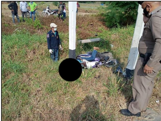
ภาพที่ ๒ สภาพรถที่เกิดเหตุ

รถจักรยานยนต์ ยี่ห้อยามาฮา พีโน สีม่วง ทะเบียน ขฉท 168 ประจวบคีรีขันธ์ สภาพรถพร้อมใช้งาน หลังเกิดอุบัติเหตุ รถจักรยานยนต์เสียหายมาก เนื่องจากเสียหลักพุ่งชนเสาปูนป้ายข้างทางด้วยความแรง ทำให้ส่วนของหน้ารถพังเสียหายทั้งหมด