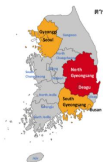
ตารางที่ 1 รายชื่อเมืองประเทศเกาหลีใต้ที่ควรหลีกเลี่ยงการเข้าไปในสถานที่คนแออัด

จีน ไต้หวัน มาเก๊า ฮ่องกง สิงคโปร์ ญี่ปุ่น (ดูรายชื่อเมืองที่ตารางที่ 2) เกาหลีใต้ (ดูรายชื่อเมืองที่ตารางที่ 1) อิตาลี อิหร่าน