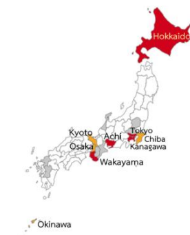
ตารางที่ 2 รายชื่อเมืองประเทศญี่ปุ่นที่ควรหลีกเลี่ยงการเข้าไปในสถานที่คนแออัด