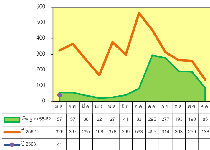
รูปที่ 1 จำนวนผู้ป่วยไข้หวัดใหญ่ปี 63 เปรียบเทียบ ปี 62 และ ค่ามัธยฐาน 58-62

อำเภอที่มีอัตราป่วยสูงสุด คือ อำเภอหัวหิน อัตราป่วย 12.18 ต่อประชากรแสนคน รองลงมาคือ อำเภอปราณบุรี, อำเภอสามร้อยยอด อำเภอบางสะพาน, อำเภอบางสะพานน้อย, อำเภอกุยบุรี, อำเภอเมือง และ อำเภอทับสะแก อัตราป่วยเท่ากับ 10.33, 8.19, 7.83, 7.52, 6.68, 3.28 และ 0.00 ต่อประชากรแสนคน ตามลำดับ (รูปที่ 2)