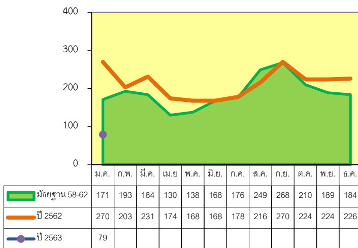
รูปที่ 3 จำนวนผู้ป่วยปอดบวมปี 63 เปรียบเทียบ ปี 62 และ ค่ามัธยฐาน 58-62

อำเภอที่มีอัตราป่วยสูงสุด คือ อำเภอปราณบุรี อัตราป่วย 21.96 ต่อประชากรแสนคน รองลงมาคือ อำเภอทับสะแก, อำเภอหัวหิน, อำเภอบางสะพาน, อำเภอกุยบุรี, อำเภอสามร้อยยอด, อำเภอบางสะพานน้อย และอำเภอเมือง อัตราป่วย 20.02, 20.01, 18.27, 13.36, 10.24, 5.01 และ 2.19 ต่อประชากรแสนคน ตามลำดับ (รูปที่ 4)