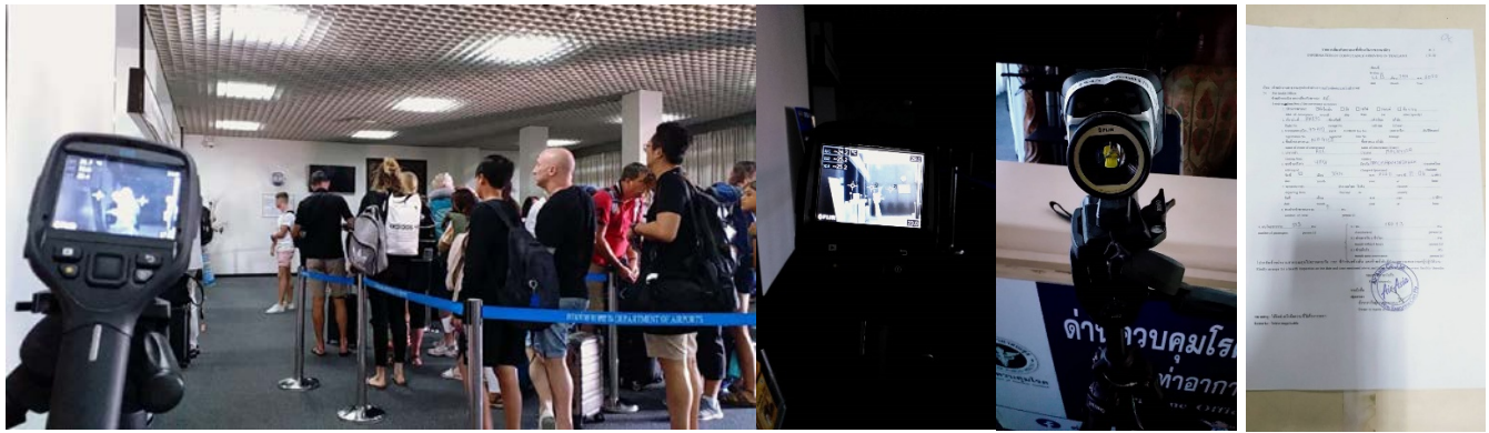
รูปการคัดกรองอุณหภูมิผู้เดินทางจากไฟล์เที่ยวบินตรงจากกัวลาลัมเปอร์ สนามบินหัวหิน