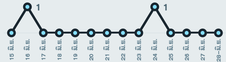
ผู้ป่วยเสียชีวิตจาก COVID

*จำนวนผู้ป่วยปอดอักเสบและใส่ท่อช่วยหายใจที่รักษาอยู่